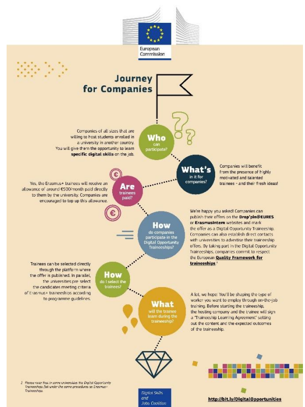
Wegwijzer voor bedrijven

Informatie-/tekstmateriaal Aanvullend materiaal, zoals: