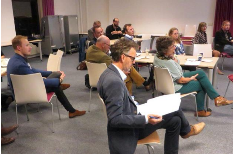
Deelnemers aan de conferentie