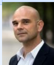
Lid APT qq