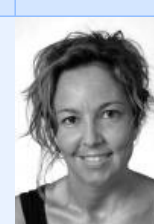
Lid APV qq